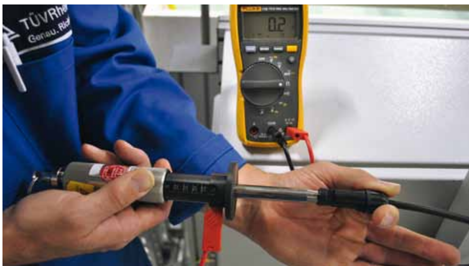
Pour deux modules sur cinq d'un fabricant chinois qui a choisi de rester anonyme, les contacteurs du connecteur mâle ont pu être touchés avec un doigt. Inadmissible car hautement dangereux !

cas du modèle chinois. Un module présente un pourcentage de 3,6 % au-dessous des indications inscrites sur la plaque signalétique et ne respecte donc plus la promesse de puissance formulée par le fabricant.